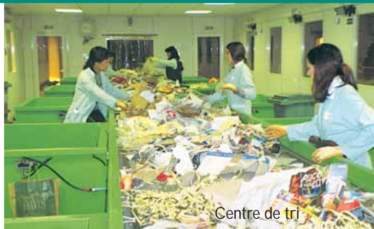
Centre de tri